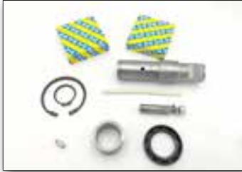
Kit réparation Ø133 mm