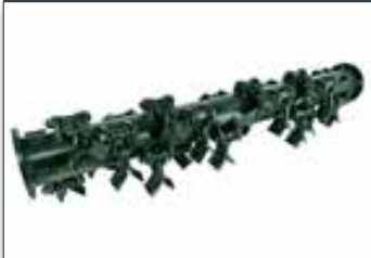
Rotor 1200 SMA MK265