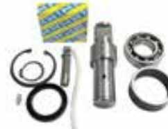
Kit réparation Ø133 mm