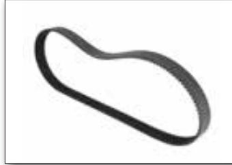
Courroie 30 mm