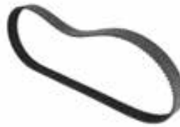
Courroie 30 mm