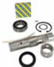
Kit réparation Ø133 mm