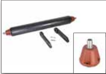
Rouleau palpeur Ø133 mm