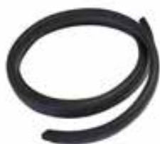
Joint carter transmission