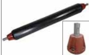
Rouleau palpeur Ø133 mm