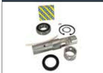
Kit réparation Ø133 mm