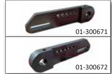
Patin renforcé Ø133 mm