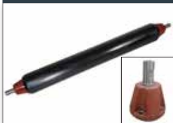
Rouleau palpeur Ø133 mm