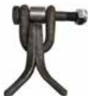
Kit fléaux Y MK311