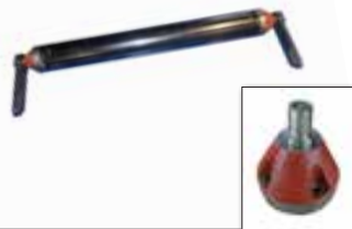
Rouleau palpeur Ø133 mm