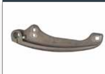
Patin renforcé Ø133 mm